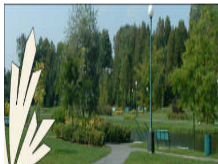
Parc de la rivière Bourbon ville de Plessisville MRC de L'Érable