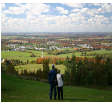
Mont Arthabaska MRC d'Arthabaska