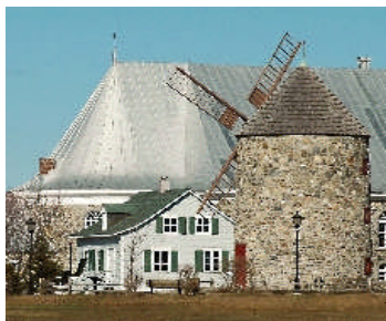
Village d'accueil de Saint-Grégoire MRC de Bécancour